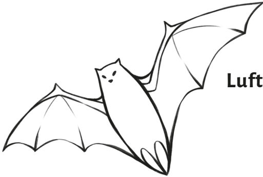
Luftmysza – nietoperz