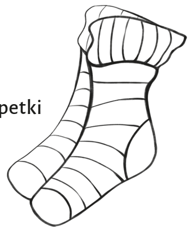
Fuzekle – skarpetki